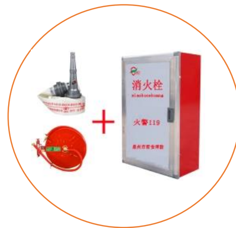
第三种类 消火栓箱